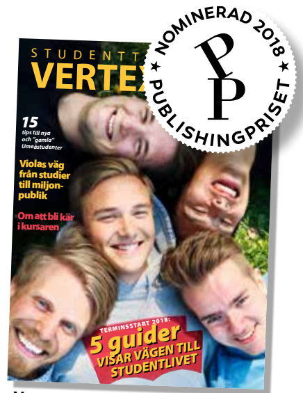
Vertex nr 4-2018.