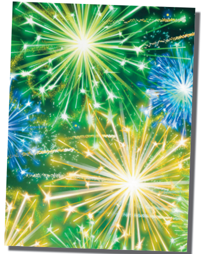
2018: Premiär för Vertex i nytt fräscht magasinformat.

WEBBTIDNINGEN vertex.nu kompletterar magasinet och innehåller också annonser. Här kan läsare klicka på din annons och komma till valfri webbsida.